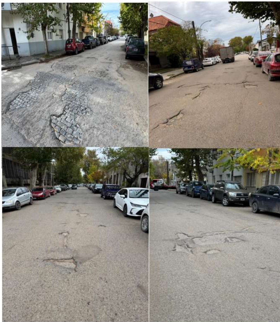
➤ Calle 55 e/ calle 60 y av. 58